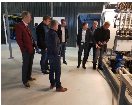
BioBooster: Neste generasjons avløpsvannløsninger.