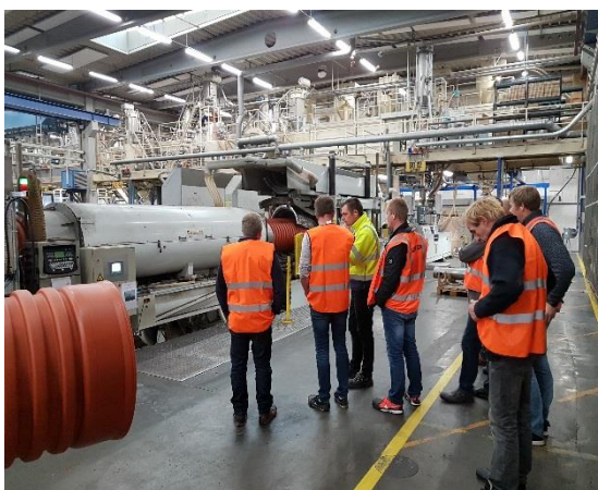
Her lages bl.a. 15 meter lange 3000 mm XL – rør.