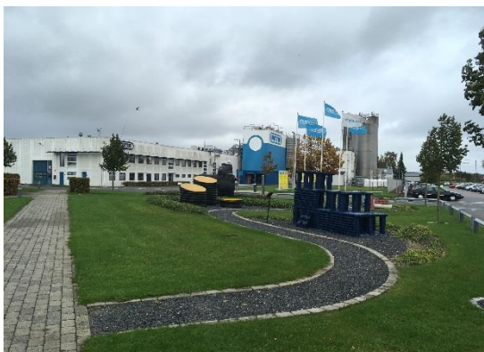
Wavin sin fabrikk på Hammel.

Etter en god lunsj på AVK reiste vi videre til Wavin, Hammel.